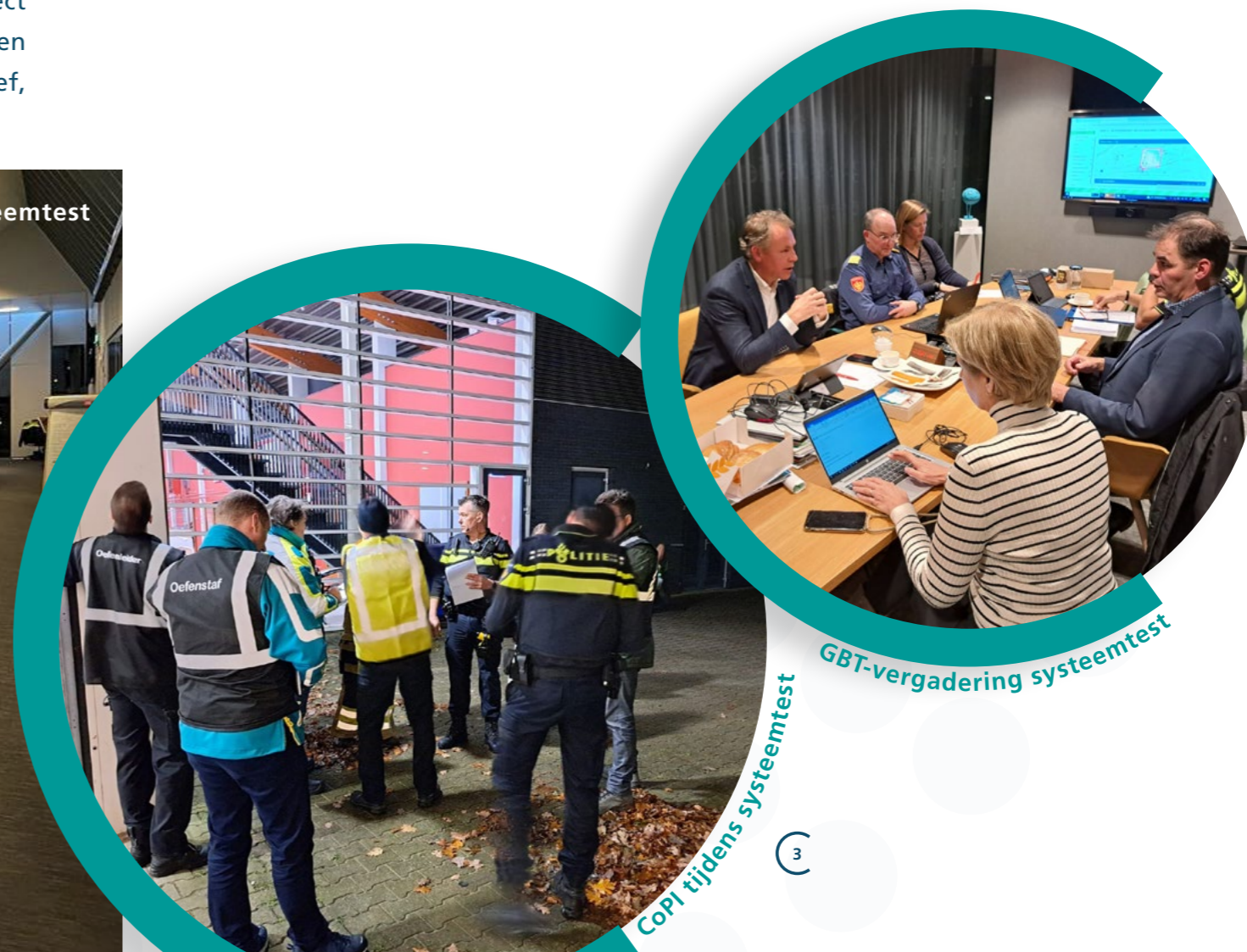
COPJ tijdens systeemtest