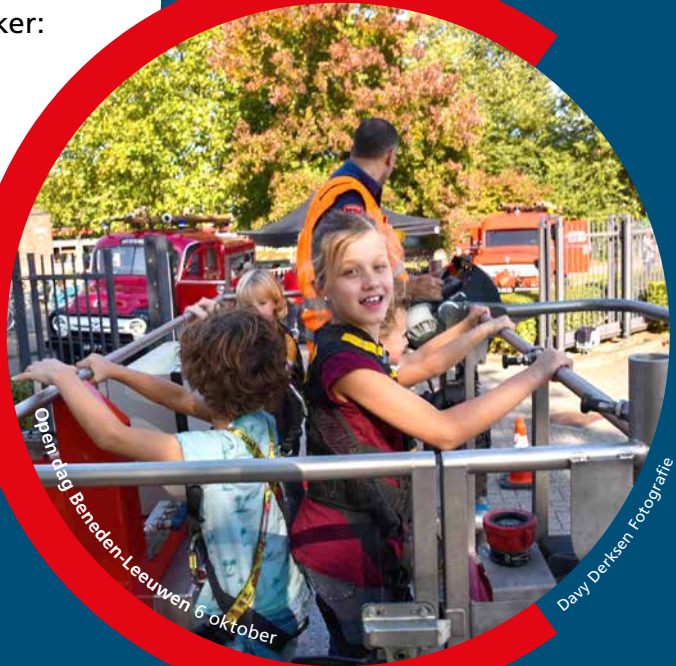
Open dag Beneden-Leeuwen 6 oktober

Honderden mensen kregen in Geldermalsen, de Bommelerwaard, Beneden-Leeuwen en Culemborg een inkijkje in het werk van onze collega's. Met zo veel enthousiasme moeten daar wel onze nieuwe brandweermannen en -vrouwen en ambulanceverpleegkundigen tussen zitten!