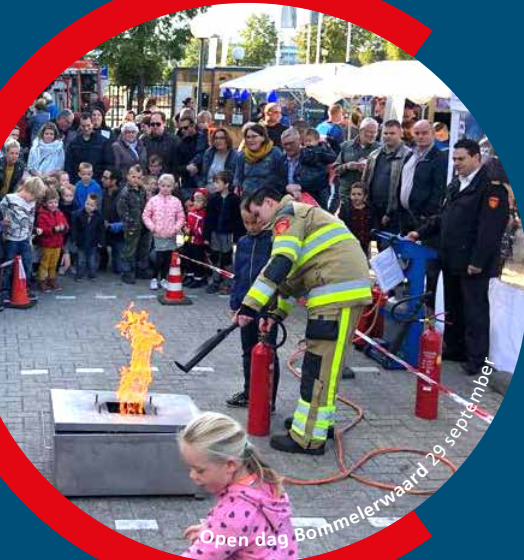
Open dag Bommelerwaard 29 september