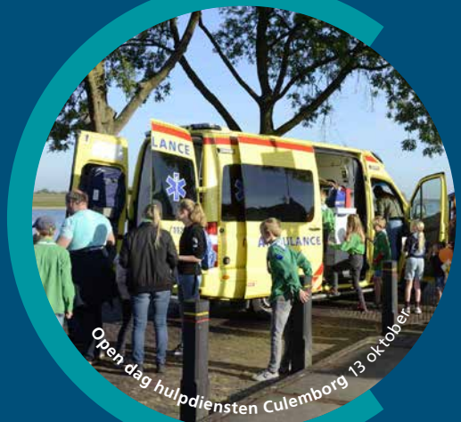
Open dag hulpdiensten Culemborg 13 oktober