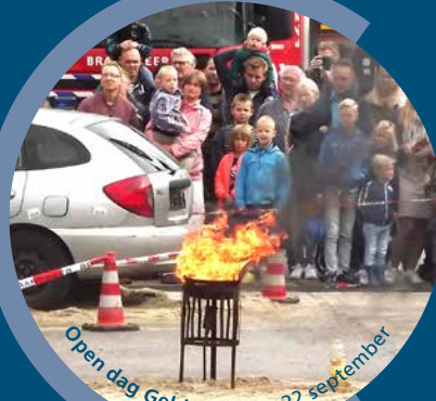
Open dag Geldermalsen 22 september