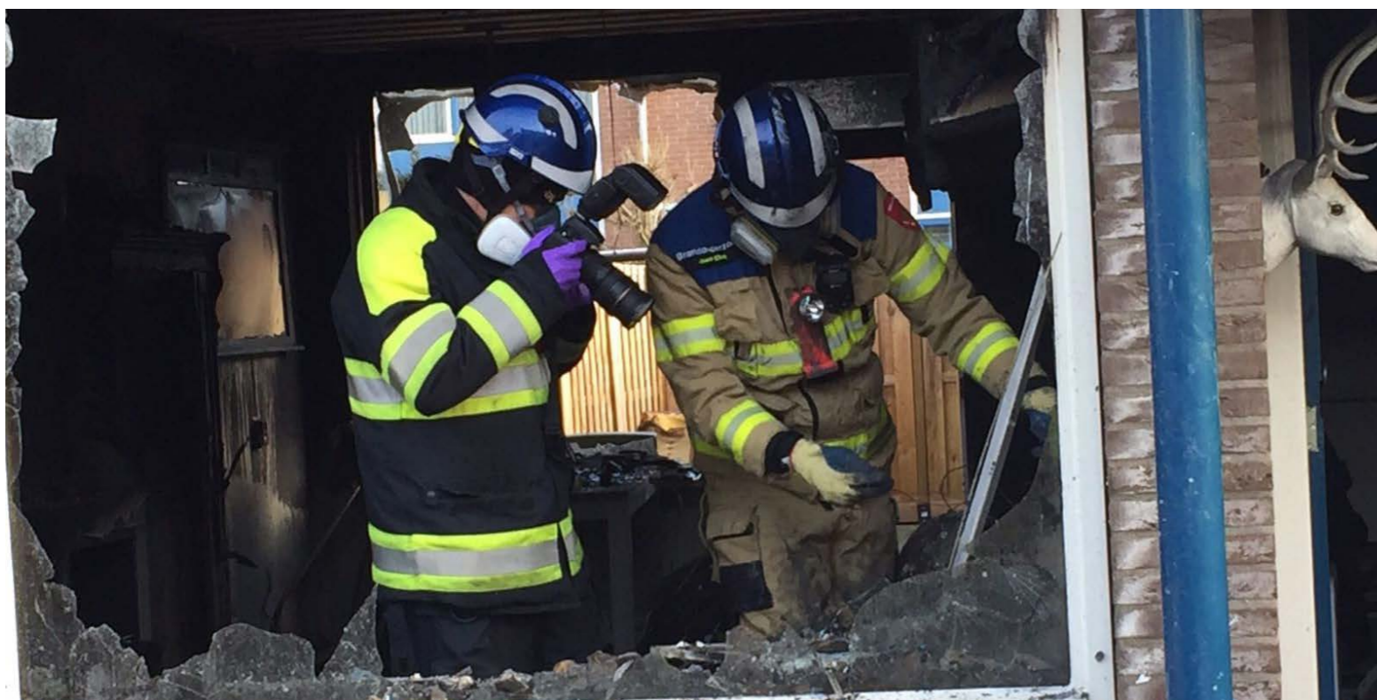
Een van onze brandonderzoekers-in-opleiding in actie, terwijl hij meeloopt met een instructeur in Gelderland-Midden.