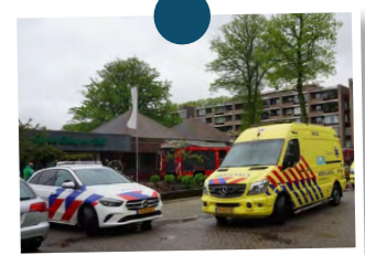
3. Brand in loods Museumpark Orientalis Berg en Dal | GRIP1