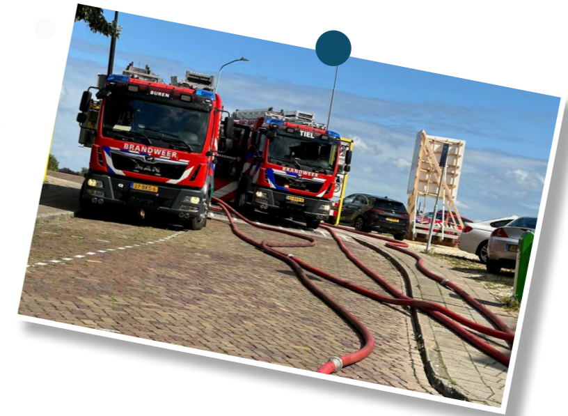
10. Keukenbrand flatgebouw Nijmegen | GRIP1