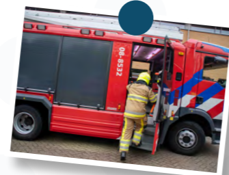
11. Tweede keer een vreemde lucht Tiel | GRIP1