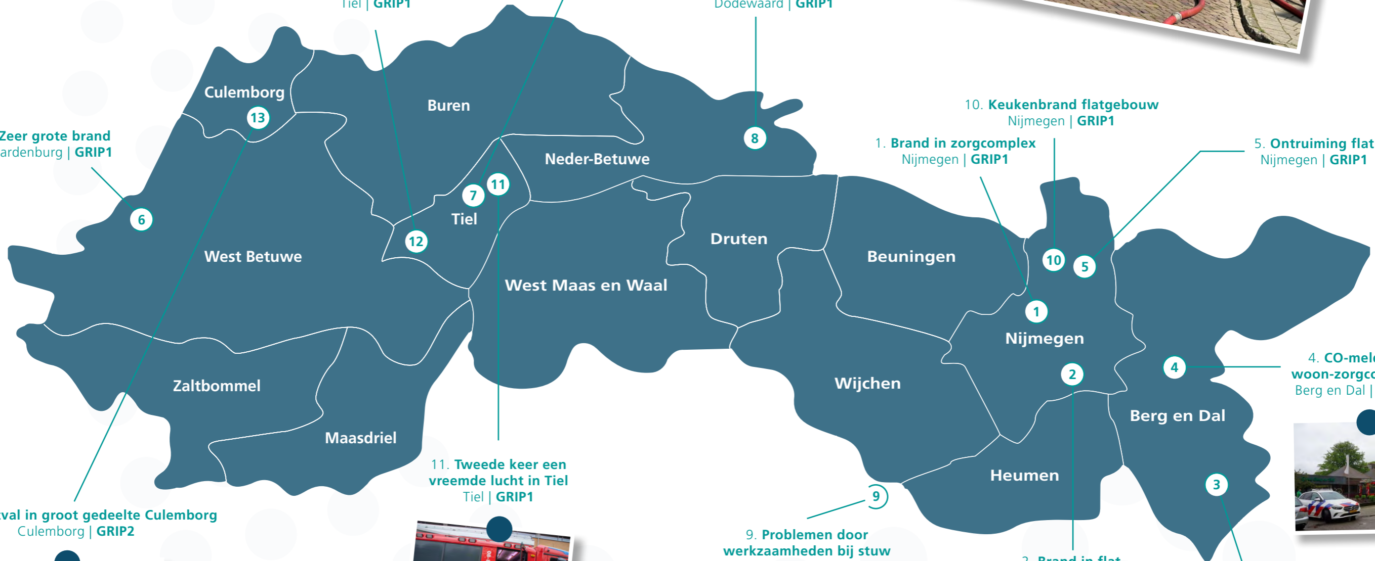
13. Gasuitval in groot gedeelte Culemborg Culemborg | GRIP2