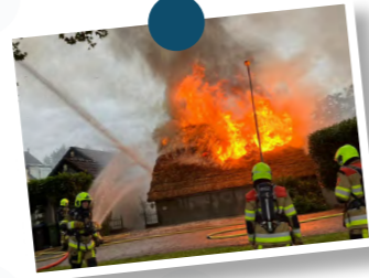
12. Uitslaande woningbrand in Tiel Tiel | GRIP1

In 2023 werd er 13 keer opgeschaald naar een GRIP: een Gecoördineerde Regionale Incidentbestrijdingsprocedure. Bij een GRIP wordt er multidisciplinair afgestemd over de bestrijding van het incident.