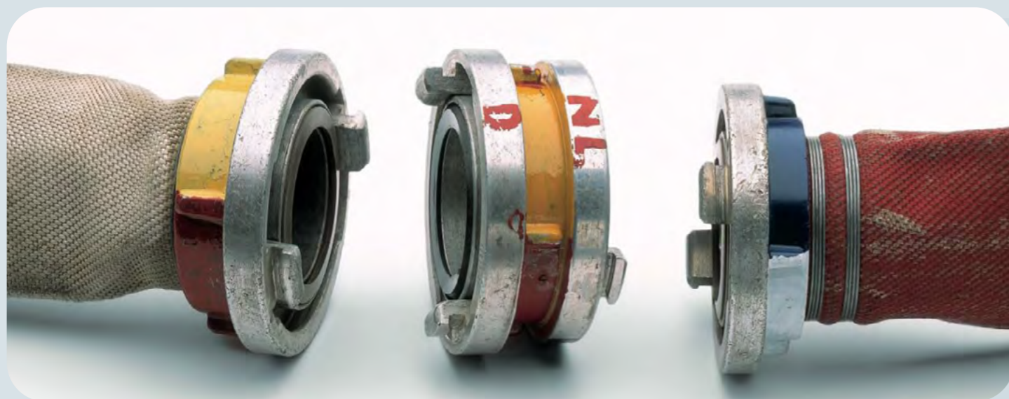
Speciaal koppelstuk tussen Duitse en Nederlandse blusslangen

Vanaf 1 juli 2023 start de projectgroep met het verbeteren en toekomstbestendig maken van de Duits-Nederlandse samenwerking. Dankzij de financiële middelen die door INTERREG VI ter beschikking worden gesteld, kan worden samengewerkt in verschillende werkpakketten, zowel op het niveau van de overheden als tussen verschillende hulpdiensten. Hierbij staat uitgebreide uitwisseling van informatie en kennis centraal en worden onder andere ook procedures voor hulpverlening bij grootschalige incidenten in de grensregio op elkaar afgestemd. Een ander onderdeel van het project is het ontwikkelen van trainingen, zoals een seminar over de bestrijding van natuurbranden voor de Duitse en Nederlandse brandweer. Daarnaast worden er ook verschillende oefeningen georganiseerd, met als hoogtepunt een internationale eindoefening in 2027.